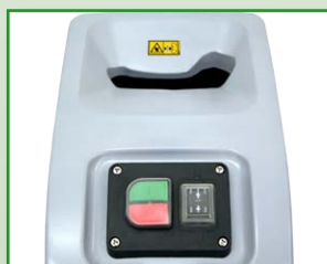
Mode réverse de débouillage