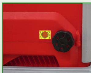
Molette de réglage de coupe