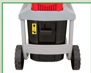
Bac récepteur avec poignée de verrouillage et dispositif d'arrêt de sécurité