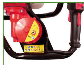
Embrayage centrifuge avec système de décompression