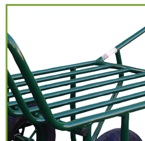
Plateau en tube \varnothing 25mm