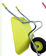
Couleur anis Réf. ACOSMOZ-A