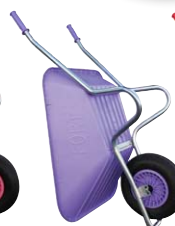
Couleur lavande Réf. ACOSMOZ-L