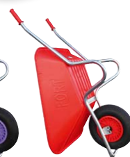
Couleur rouge Réf. ACOSMOZ-R