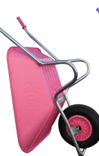
Couleur rose Réf. ACOSMOZ-P