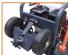
Kit de roues intégré en série