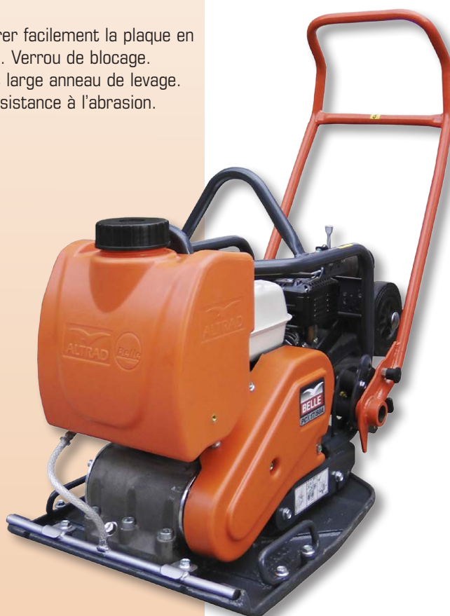
Semelle surbaissée, largeur 50 cm, permet de passer sous les bardages.