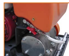
Robinet renforcé pour un gros débit d'eau