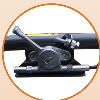
Accélérateur renforcé sur le cadre