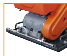
Rampe d'arrosage intégrée.