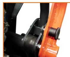
Système anti-vibration et verrouillage du timon