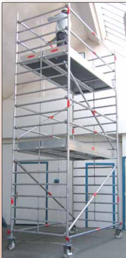
Aluxis 140 hauteur plancher 4,00 m Réf. 612701

Conforme au décret du 1 er septembre 2004