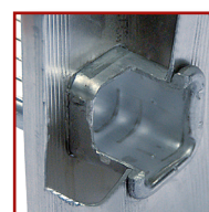
Echelons 30 x 30 mm sertis, triple expansion anti-rotation