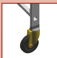
4 roues Ø 100 mm avec frein