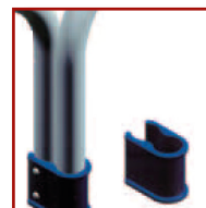
Insert en polyamide pour faciliter la rotation des articulations