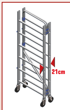
Montage et démontage rapide châssis pliable