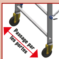
Passage par les portes