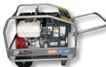
centrale Midi 20-140