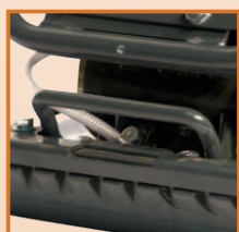
Rampe d'arrosage protégée