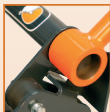
Système anti vibration