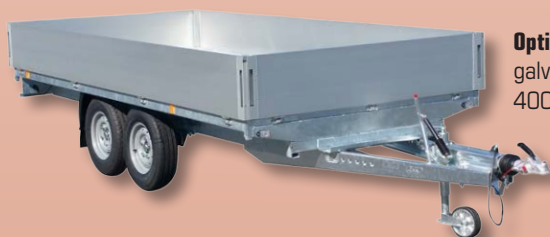
Option : Kit ridelles galvanisées hauteur 400 mm