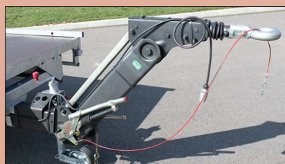
Option : Attelage timon articulé réglable en hauteur avec attache anneau 68/42 (hauteur 420 à 950 mm)