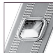
Echelon rhomboïdal 30 x 30 mm, confort d'utilisation optimal