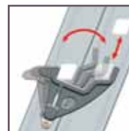
Basculeurs en fonte d'aluminium à rappel automatique