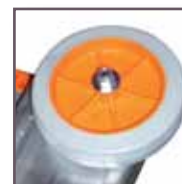
2 roulettes Ø 100 mm non marquantes, facilitant le développement