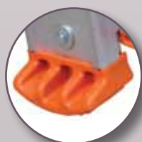
Patins rentrants extra-larges, boulonnés, antidérapants