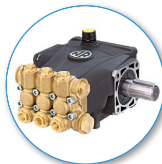
Pompe RCV (320) ANNOVI REVERBERI Villebrequin 3 pistons céramique, têtes en laiton