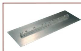
Pâle de finition