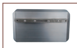
Pâle type universelle écrou flottant